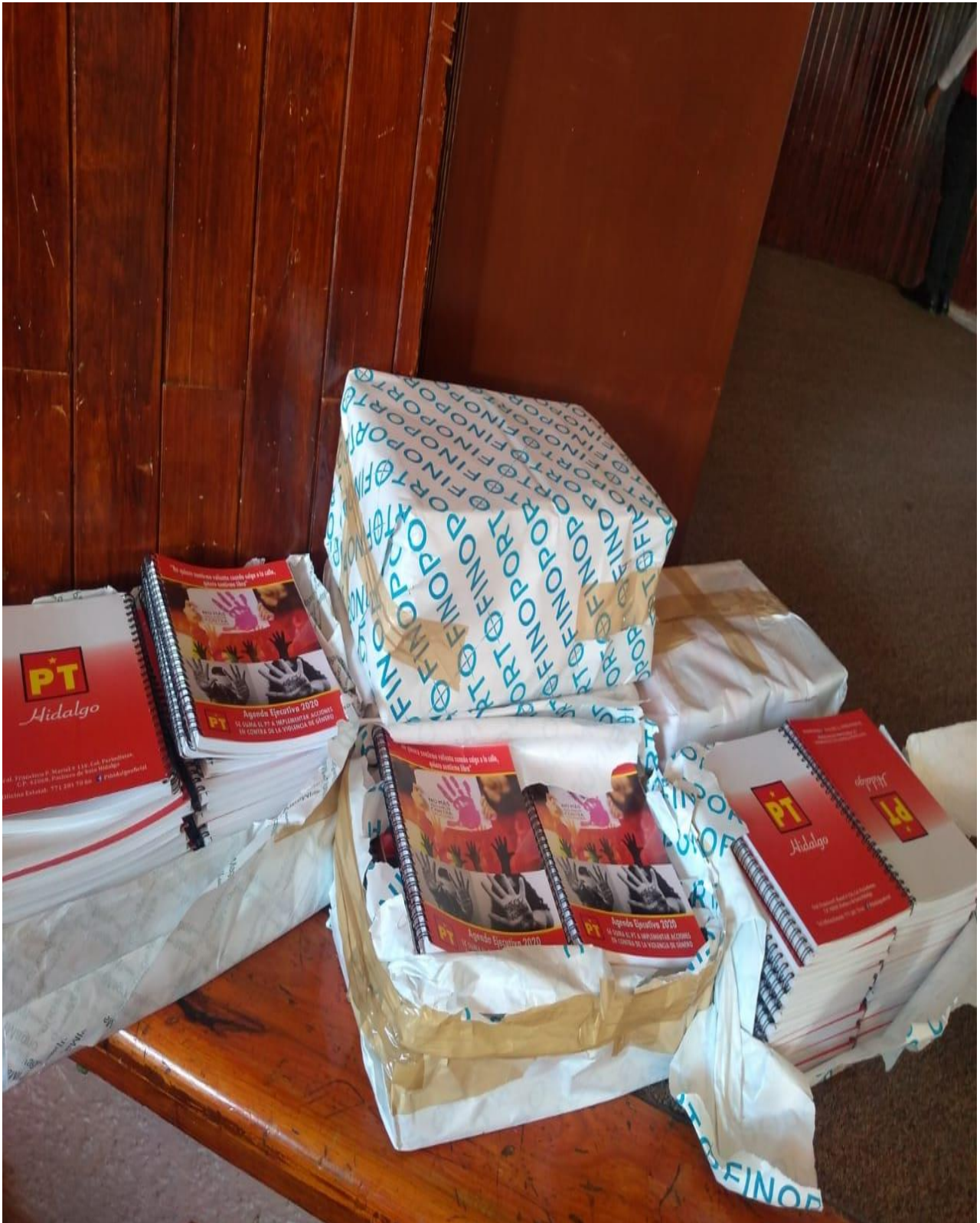
PACHUCA DE SOTO, ESTADO DE HIDALGO 30 enero de 2020.