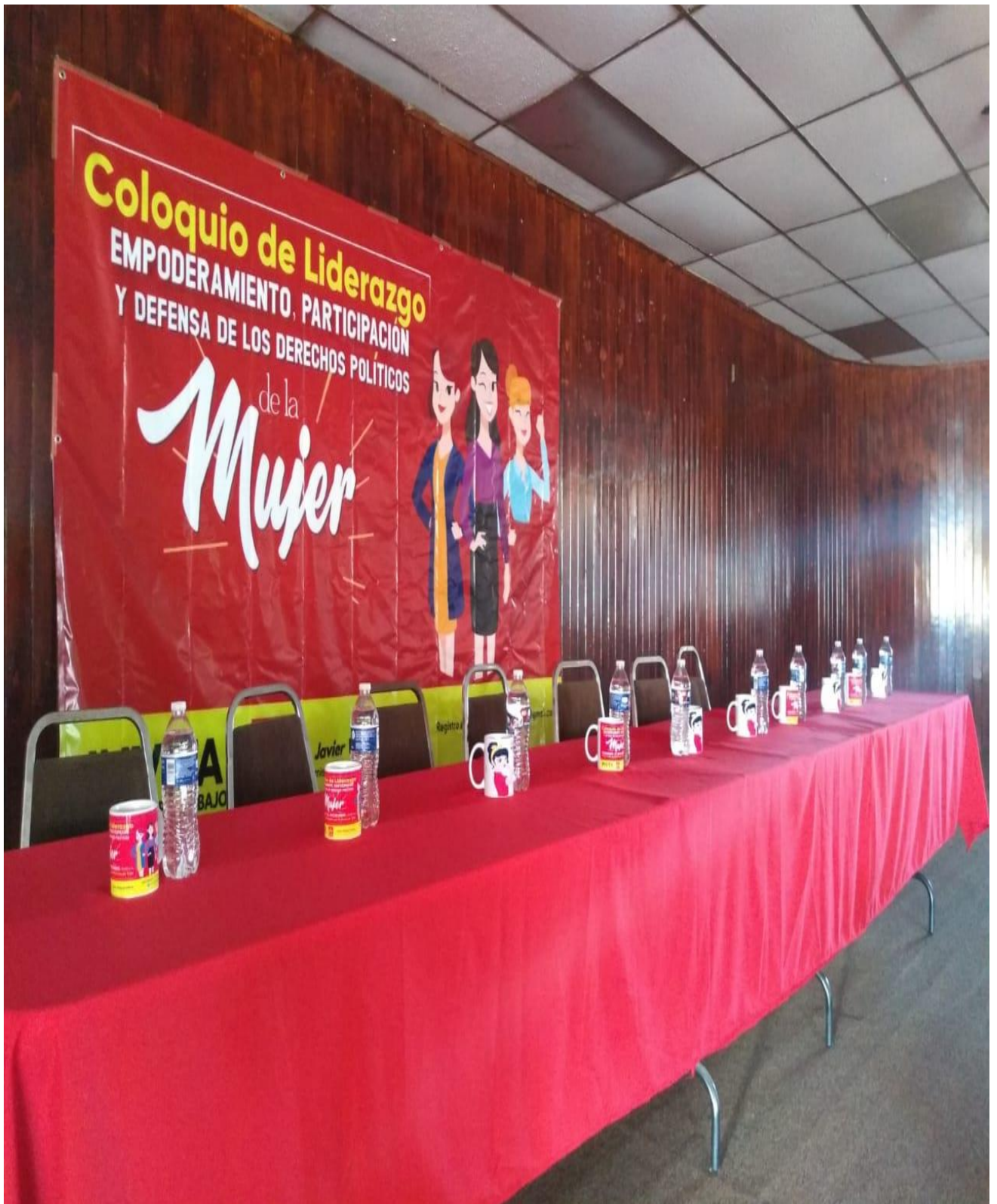
PACHUCA DE SOTO, ESTADO DE HIDALGO 30 enero de 2020.