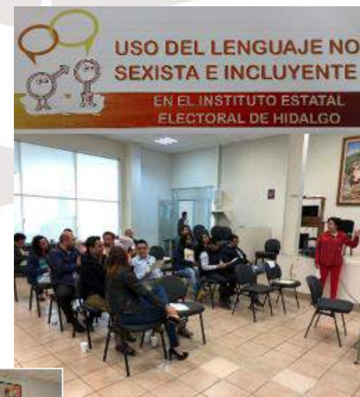
Curso-Taller “Uso del lenguaje no sexista e incluyente”